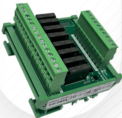
DM-RB 8 S